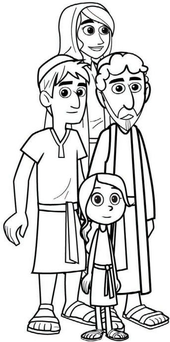
FAMILIA DE ESTER