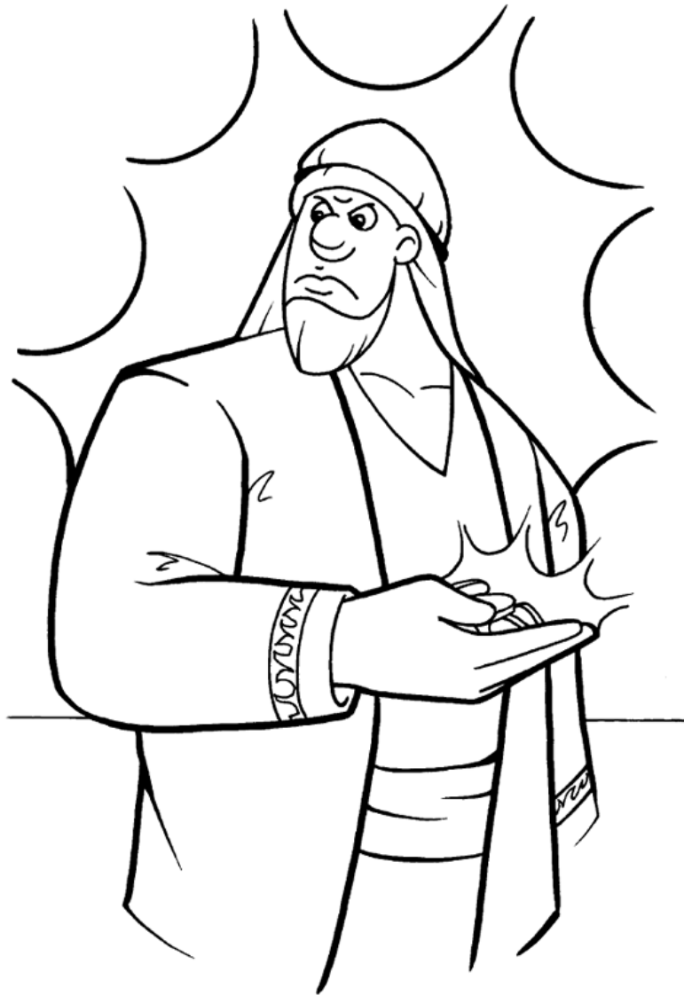
La Parábola de los talentos Mateo 25:14-20